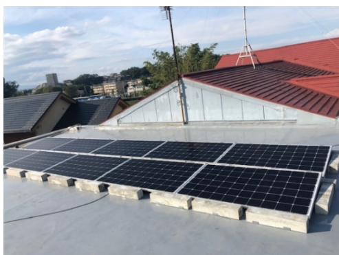
（園舎屋上に設置された太陽光発電システム）

プロジェクト第 2 号となった清瀬富士見幼稚園は東京都清瀬市にある幼稚園で、当日のセレモニーには約 300 名の子どもたちと職員の方々にご参加いただきました。設置した 3.15kW の自家消費型太陽光発電システムの年間予想発電量 3,633kWh は、1,967kg-CO 2 の二酸化炭素削減量に相当します。*