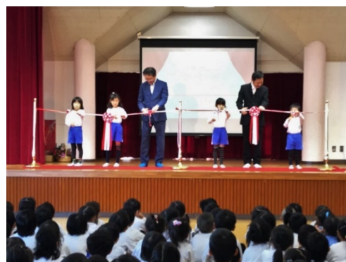
（セレモニーにて テープカットの様子）